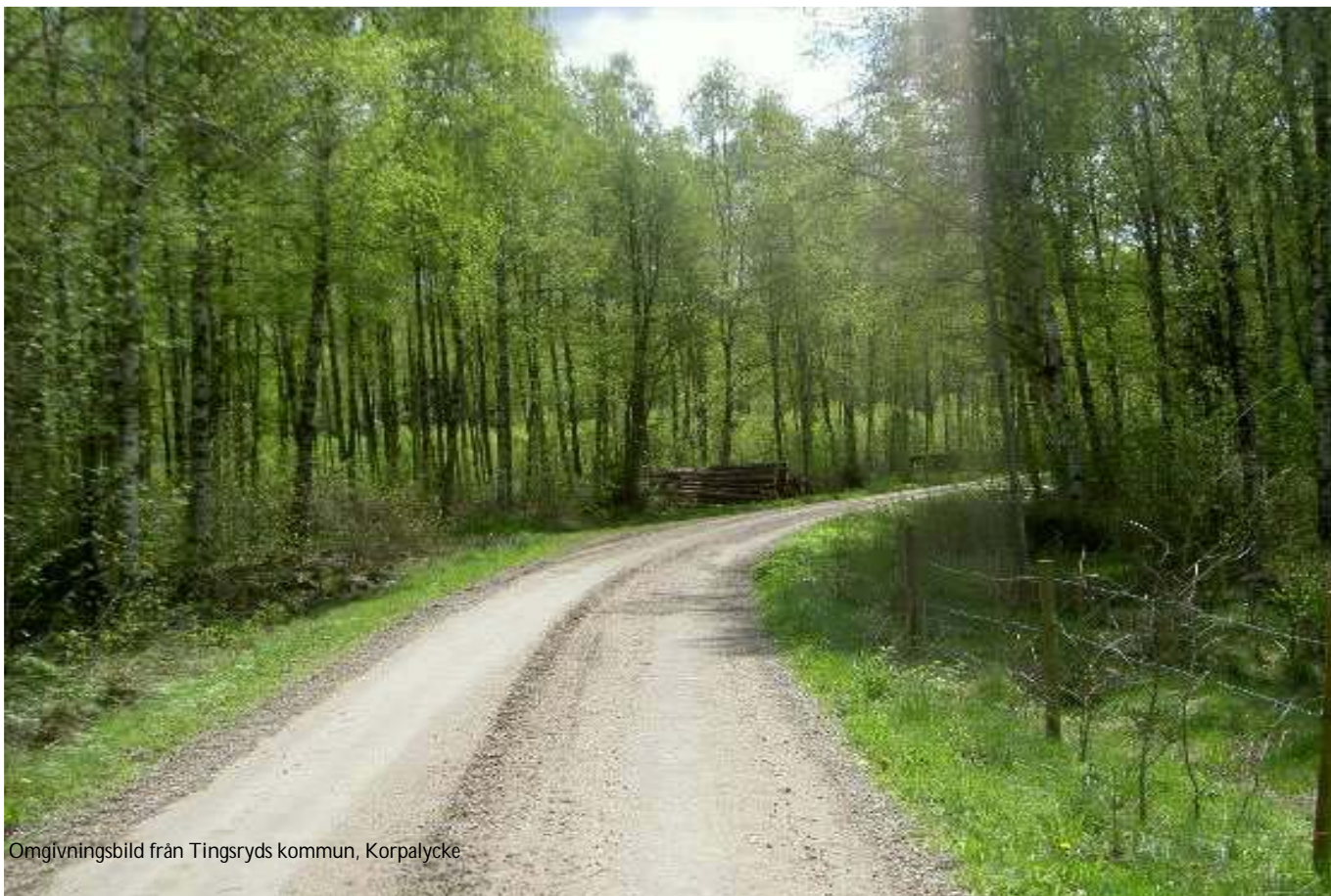
Omgivningsbild från Tingsryds kommun, Korpalycke

För att förtydliga vindkraftverkens nytta ska även den samlade energiproduktion från verken och vart energin levereras redovisas.