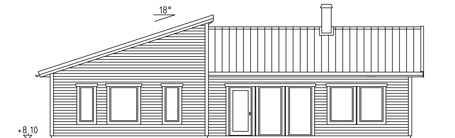
FASAD MOT GÅRD